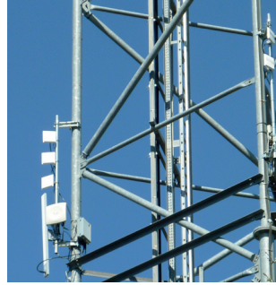
Exemple d'équipement RLAN

Le plus souvent la puissance de l'équipement RLAN (PIRE) est trop élevée ou le système dynamique de sélection de fréquences (DFS) est désactivé.