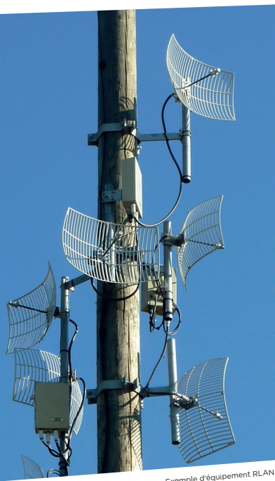
Exemple d'équipement RLAN

En tant que détenteur d'un réseau RLAN dans la bande 5GHz, vous êtes garant de l'utilisation conforme des fréquences et vous êtes responsable si votre équipement est à l'origine d'un brouillage !